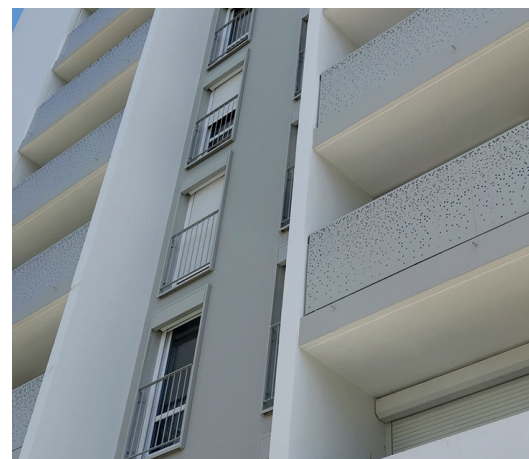
▲ Habillage des garde-corps des balcons

A l'intérieur, des travaux de modernisation des salles de bain et toilettes sont réalisés : équipements, murs, sol, tout est refait à neuf. A terme, les logements T3 disposeront d'une douche et les T4 d'une baignoire. Dans la pièce de vie des T4, des portes coulissantes sont proposées aux locataires afin d'avoir 2 espaces distincts. Côté cuisine, les éviers et meubles sous-éviers sont remplacés en fonction de l'état de vétusté. Enfin dans l'entrée, un cache compteur électrique et un visiophone seront installés dans tous les logements.