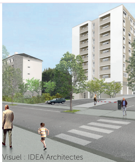
Visuel : IDEA Architectes

La création d'ascenseurs dans la barre D (1 par cage d'escalier) commencera en 2021.