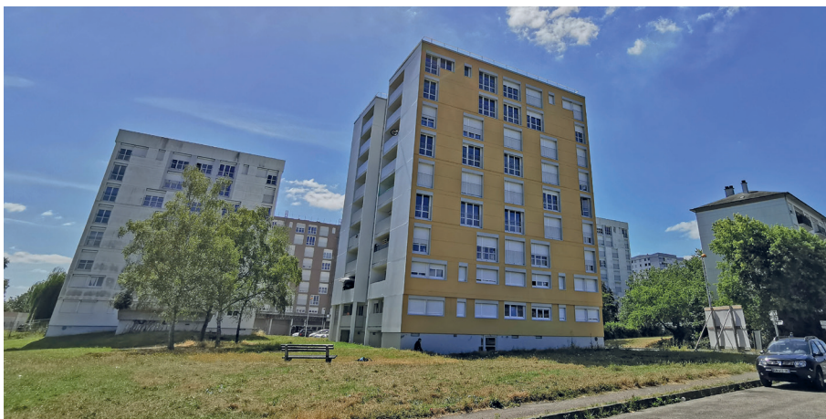
▲ Vue d'ensemble des tours A, B et C Boulevard Kellermann