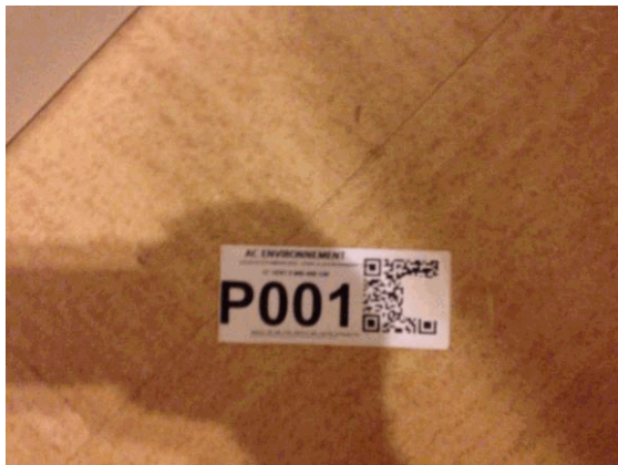
002NI001571 n°1 - 1 (P1)