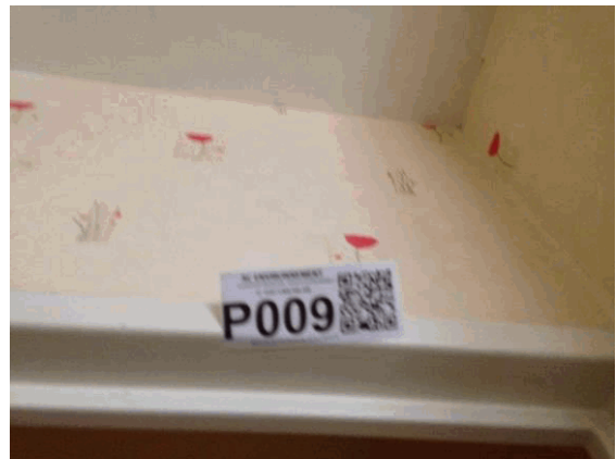
002NI001571 n°9 - 1 (P9)