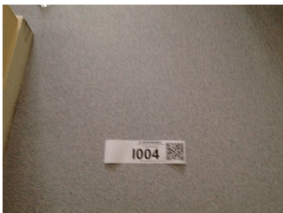
I4 - 1