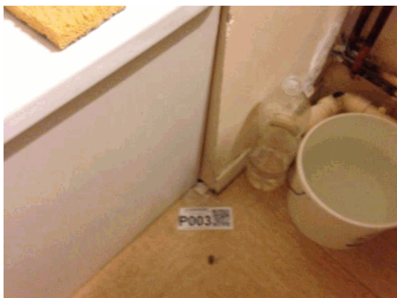
002NI001571 n°3 - 2 (P3)