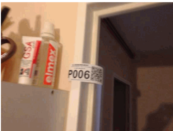
002NI001571 n°6 - 1 (P6)