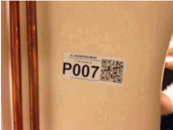
002NI001571 n°7 - 2 (P7)