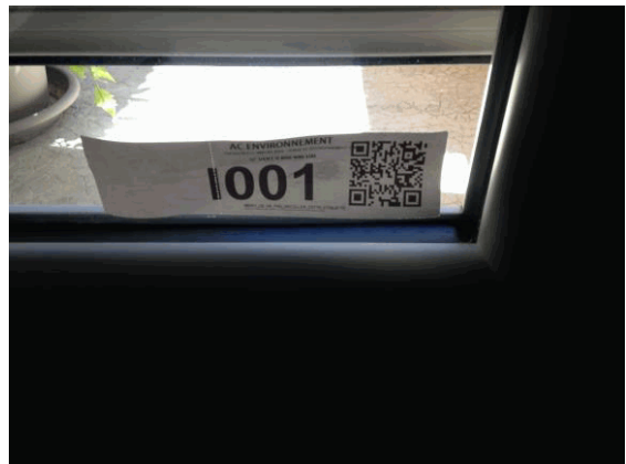
I1 - 1