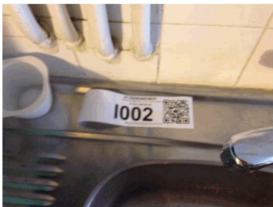
I2 - 1