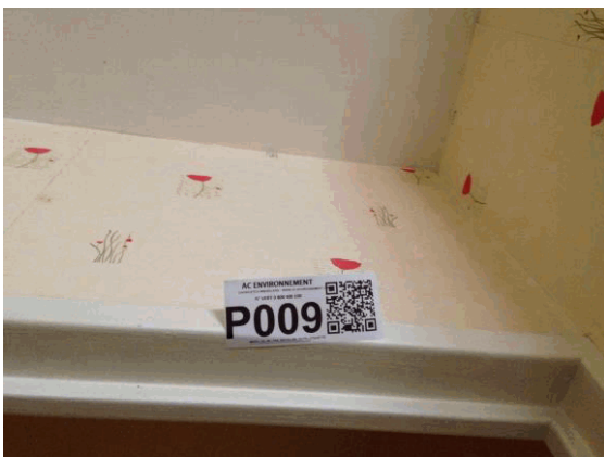
002NI001571 n°9 - 2 (P9)