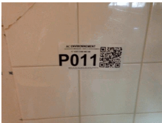
002NI001571 n°11 - 2 (P11)