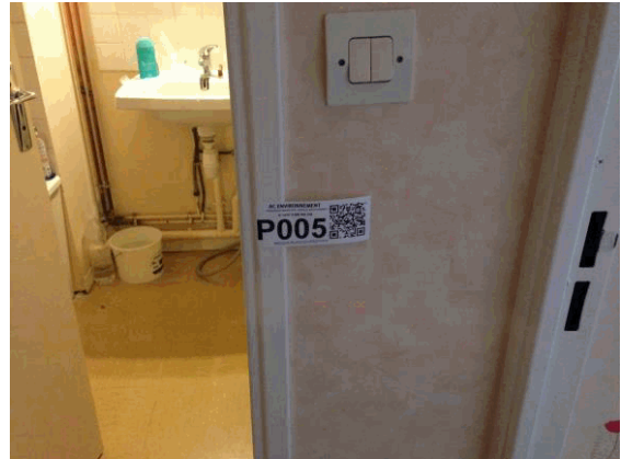
002NI001571 n°5 - 2 (P5)