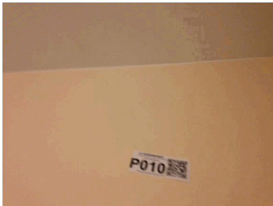
002NI001571 n°10 - 1 (P10)