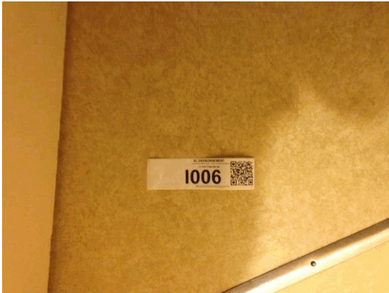
I6 - 1