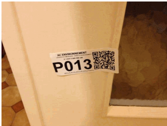
002NI001571 n°13 - 1 (P13)