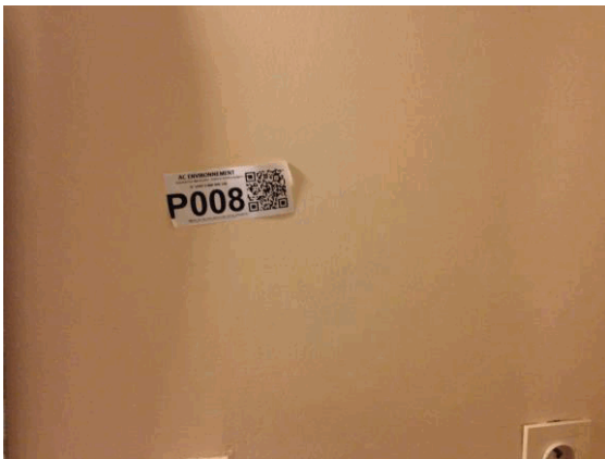
002NI001571 n°8 - 1 (P8)