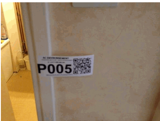
002NI001571 n°5 - 1 (P5)