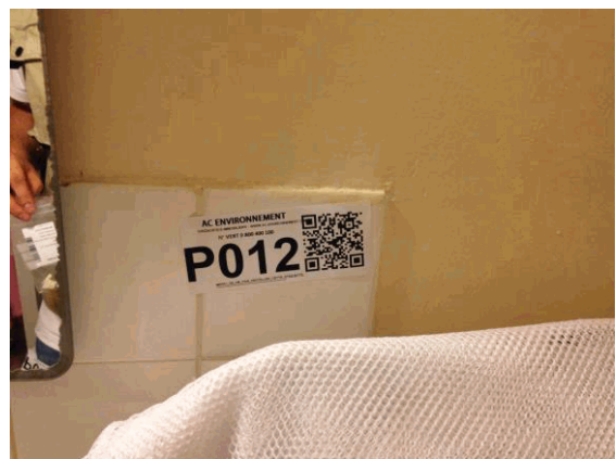
002NI001571 n°12 - 1 (P12)