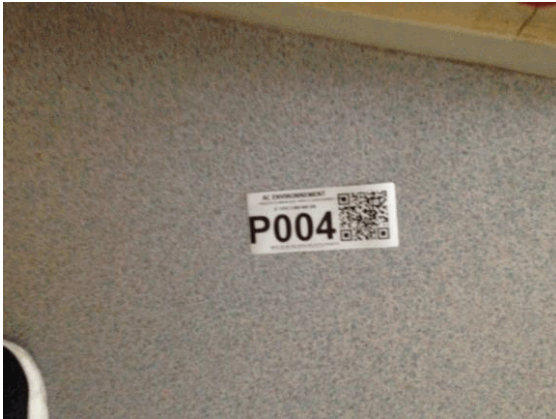
002NI001571 n°4 - 1 (P4)