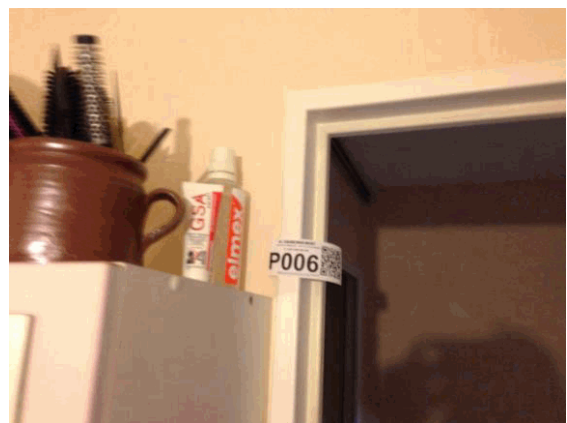
002NI001571 n°6 - 2 (P6)