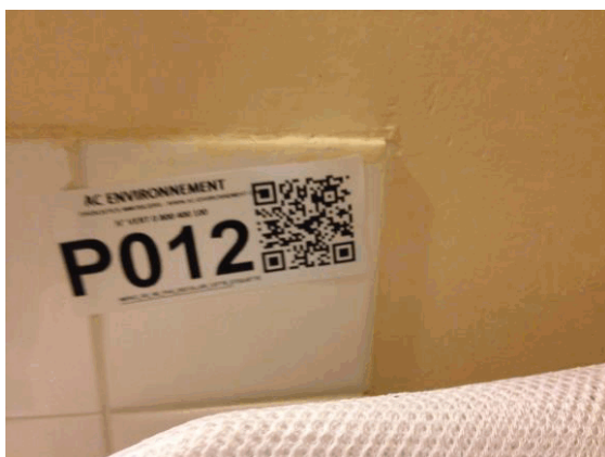
002NI001571 n°12 - 2 (P12)