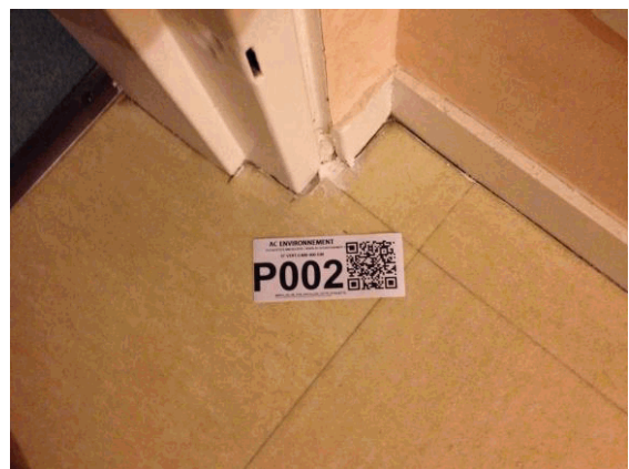
002NI001571 n°2 - 1 (P2)