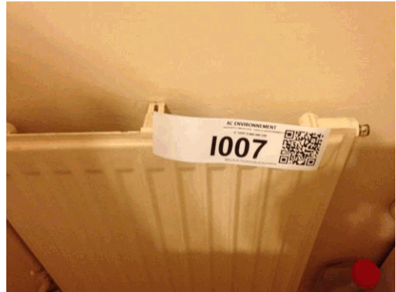
I7 - 1