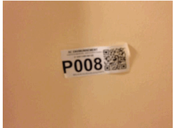
002NI001571 n°8 - 2 (P8)