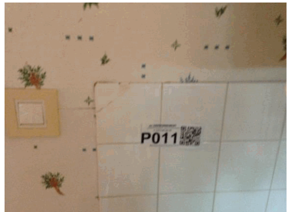
002NI001571 n°11 - 1 (P11)