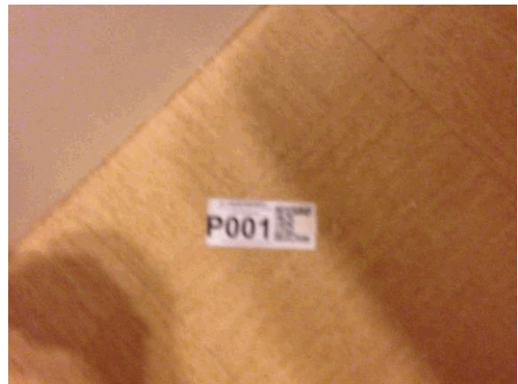
002NI001571 n°1 - 2 (P1)