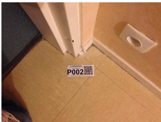
002NI001571 n°2 - 2 (P2)