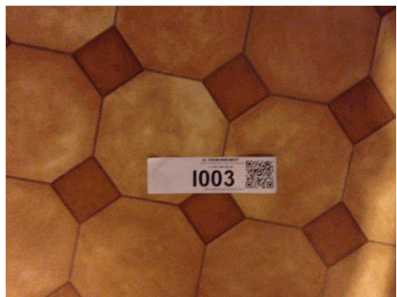
I3 - 1